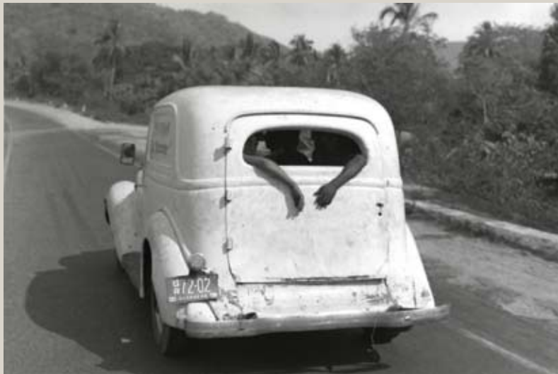
Sur la route d'Acapulco, Mexique, 1965