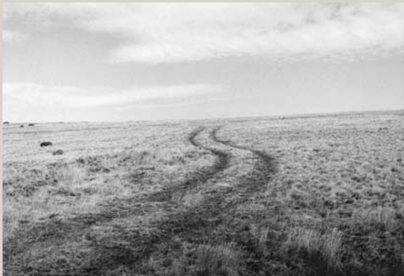
Massif du Tinarque, Ardèche, 2110.

avec Bernard Plossu le samedi 3 décembre à 15h Signature du livre : Le pays des petites routes (En Ardèche)