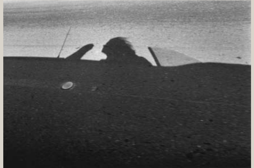
Autoportrait, California, 1974