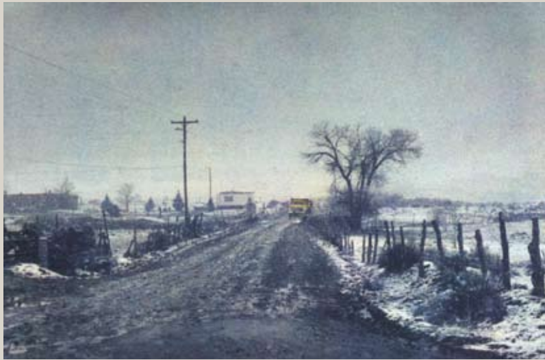
Taos, Nouveau Mexique, 1978.