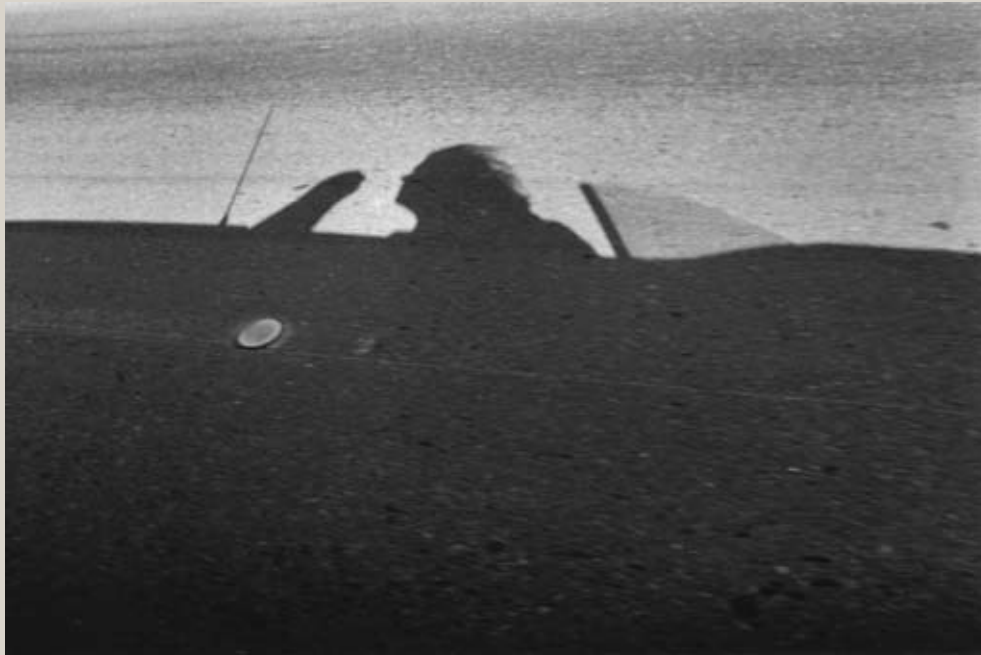
Autoportrait, Californie, 1974