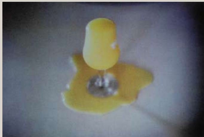
Le jus d'orange, USA, 1980.