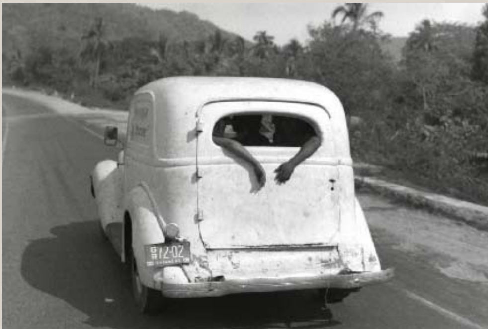
Sur la route d'Acapulco, Mexique, 1965.