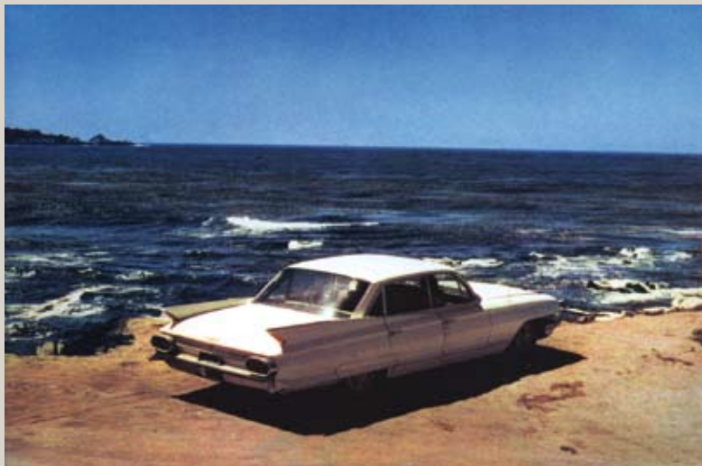
Camel, Californie, 1974

Entre ces deux pôles temporels, un choix forcément limité et subjectif de quelques images, inédites ou célèbres, pour parler des thèmes chers à Plossu : le voyage, la légèreté, la couleur (Oui ! Plossu est aussi le photographe de la couleur pour laquelle il collabore depuis les années 70 avec l'atelier Fresson), le "cubisme", la fulgurance de l'instant, fut-il "non décisif"... comme un hommage provisoire à un regard qui, mine de rien, a profondément marqué la photographie française des quarante dernières années.