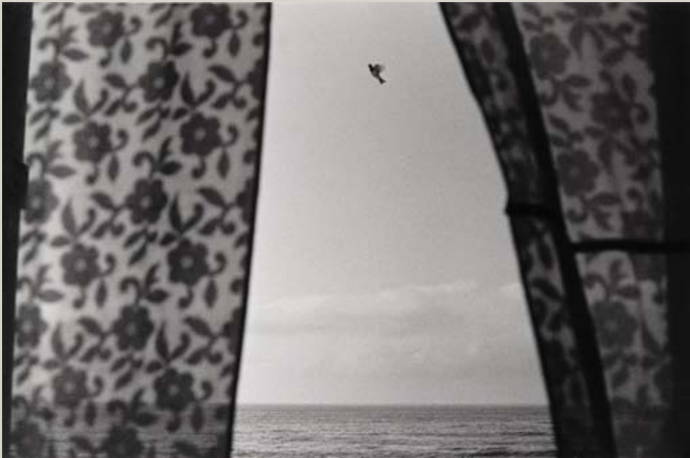
Aglou, Maroc, 1975.