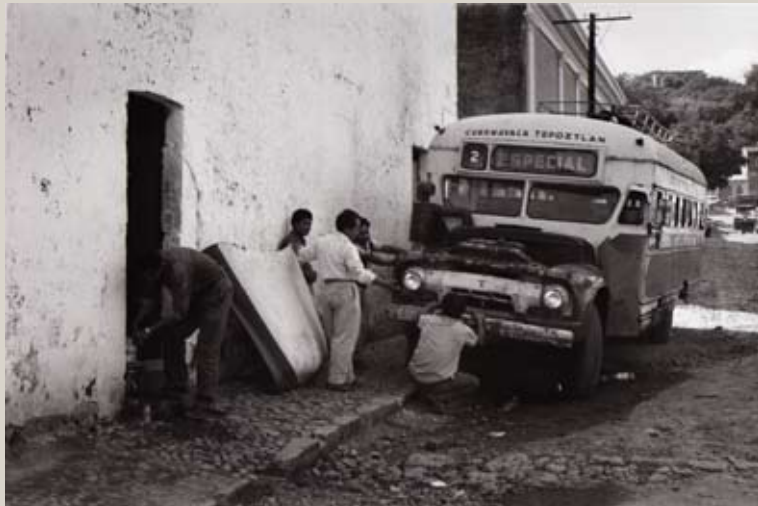
Tepozilan, Mexique, 1966.