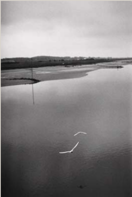
Nord de la France, 1990.