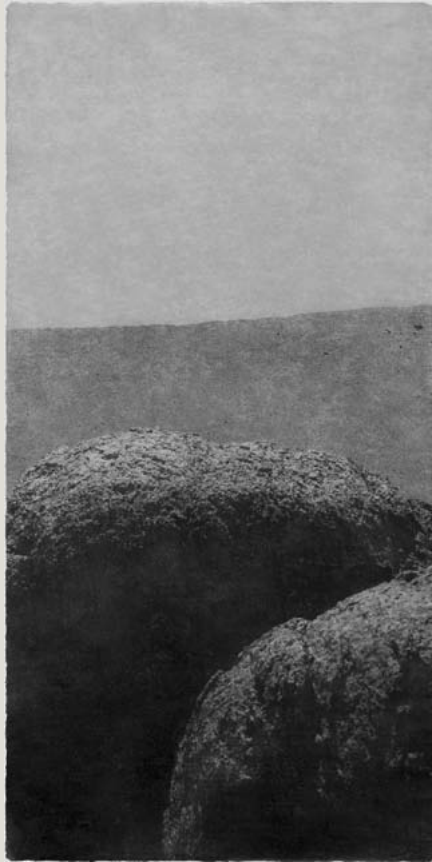
Opening #02, 2015