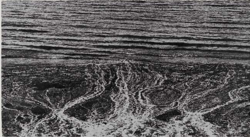
Ocean 99-06, 1999