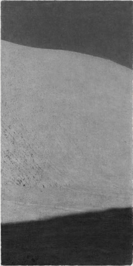
Opening #07, 2015