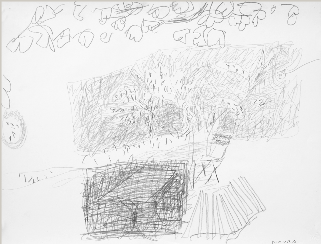
Le Clos Saint-Pierre, 1982. Dessin. 50 x 65 cm