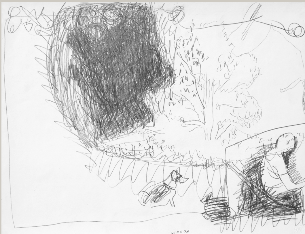
Le Clos Saint-Pierre, 1982. Dessin. 50 x 65 cm