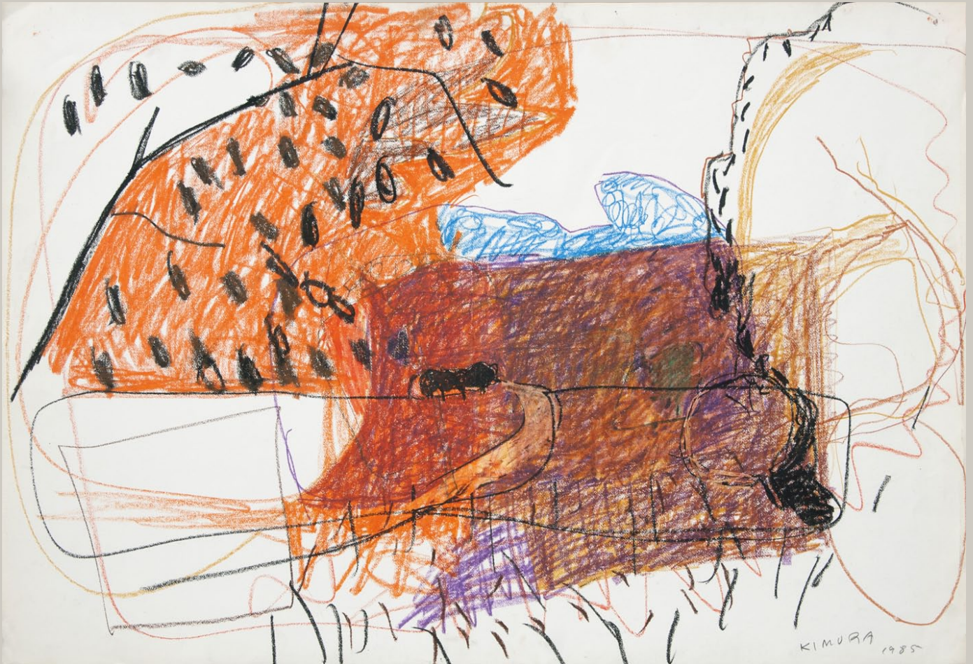
Le Clos Saint-Pierre, 1985. Pastel. 75 x 110 cm

«On ressent le rayonnement d'une joie véritablement religieuse dans son oeuvre, à côté duquel les plaisirs ordinaires de la vie, fût-elle heureuse, n'ont aucun poids. La relation de Kimura avec son art se rapproche sans doute de cette union extasiée avec une réalité éblouissante dont on parle parfois dans les textes mystiques.» (Athur C. Danto)