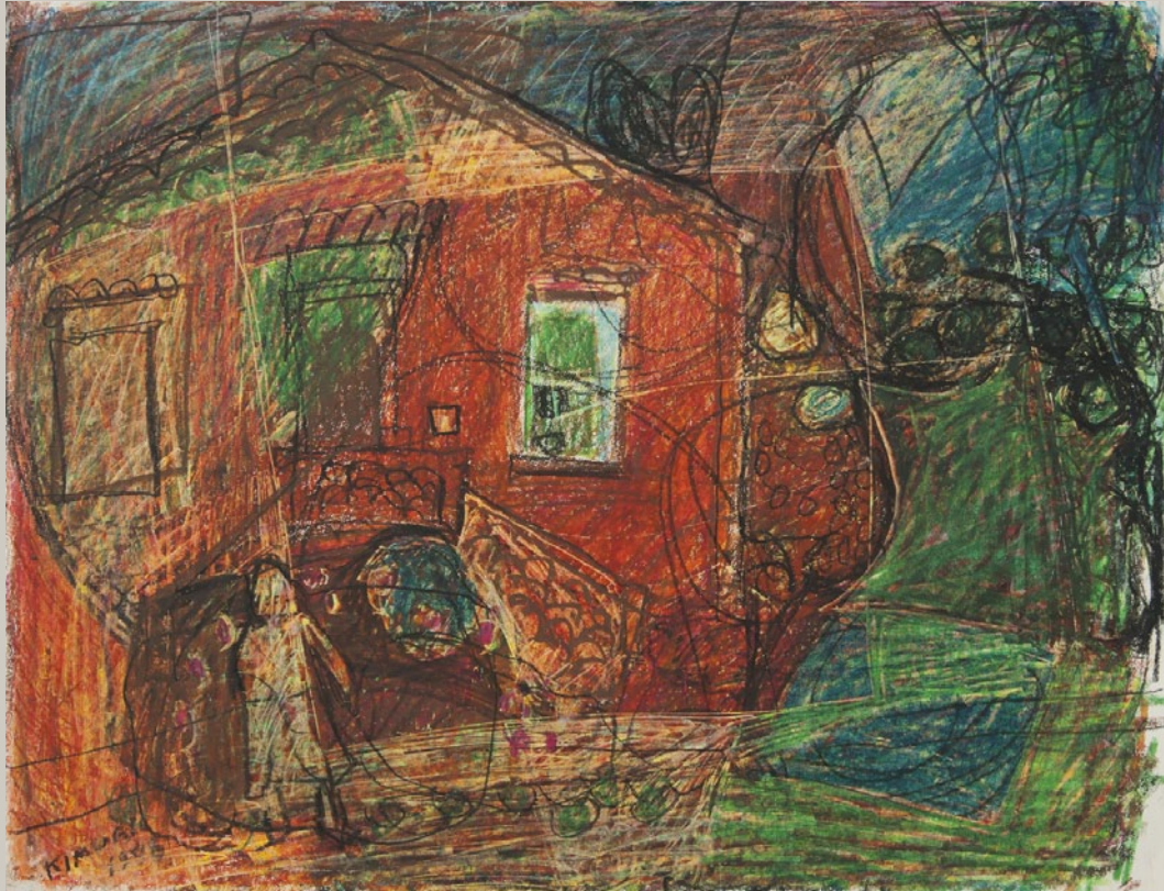
Le Clos Saint-Pierre, 1978. Pastel. 50 x 65 cm