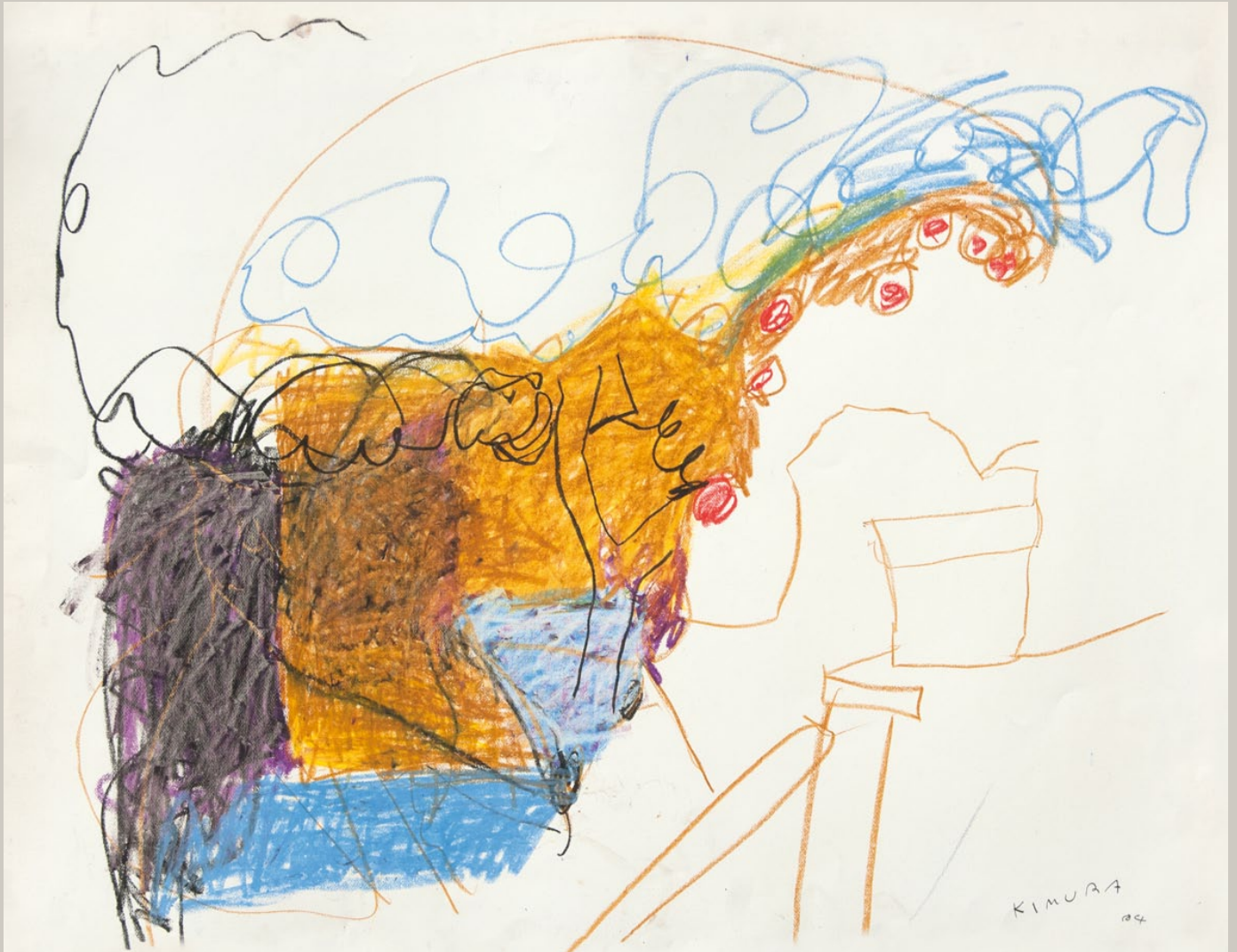
Le Clos Saint-Pierre, 1984. Pastel. 75 x 100 cm