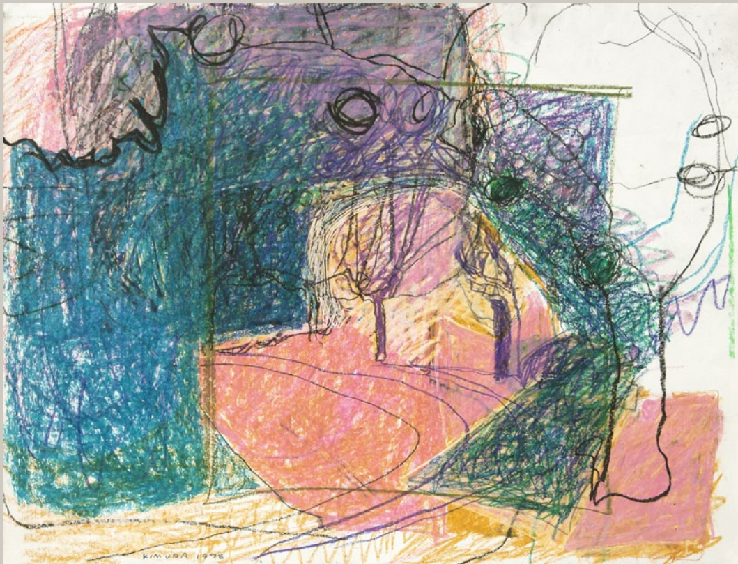
Le Clos Saint-Pierre, 1978. Pastel. 50 x 65 cm