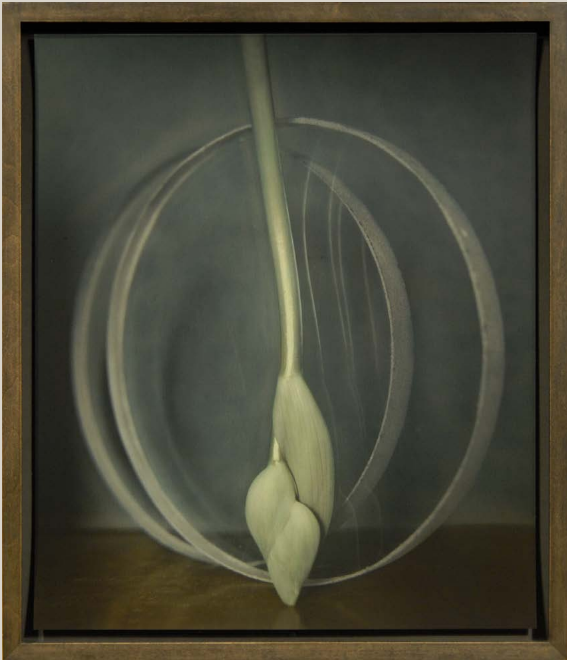
Sans titre, série "GLAS", 2015.

Tirage argentique rehaussé à la peinture à l'huile. 40 x 50 cm. Edition de 8 exemplaires