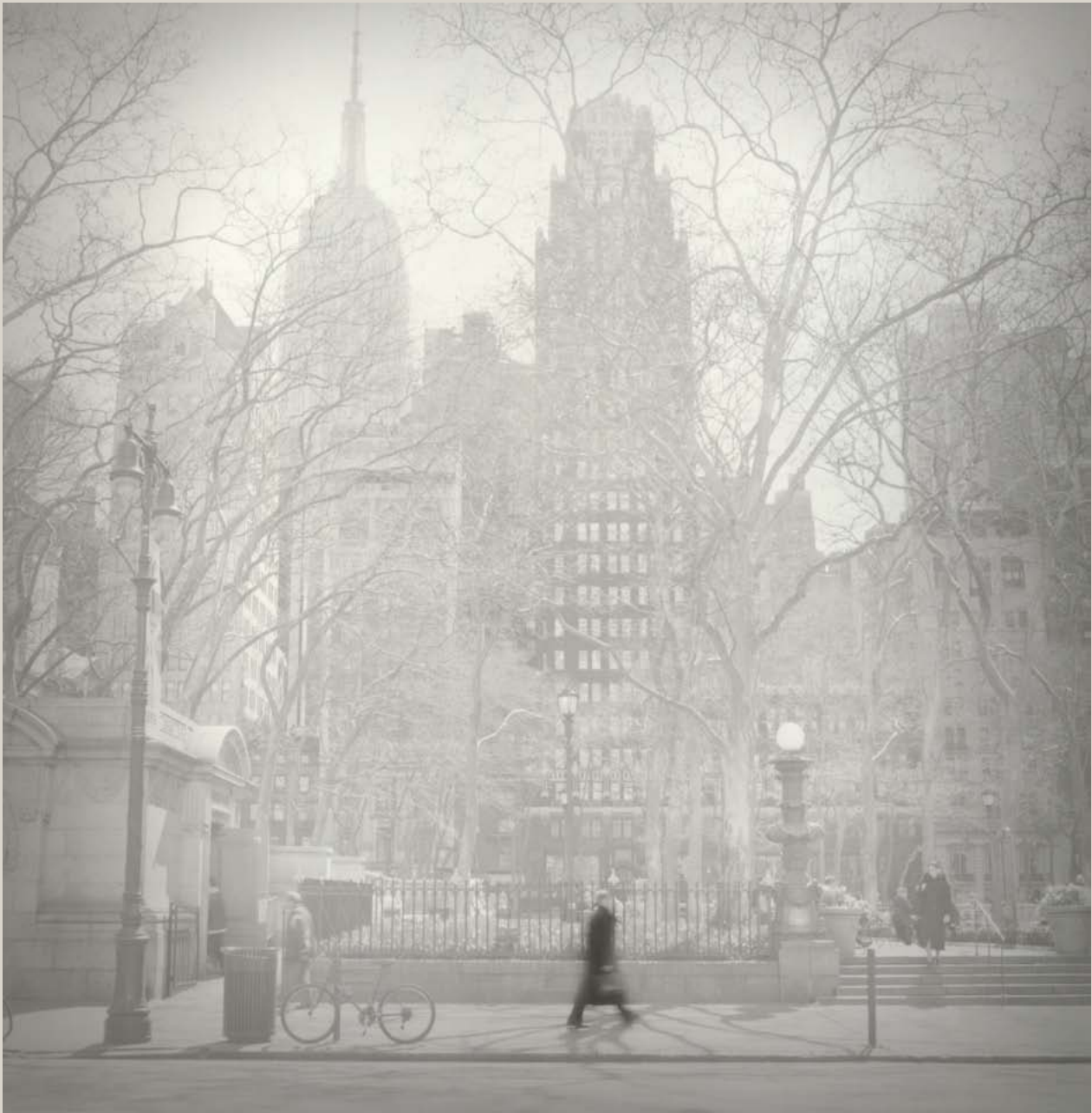
Bryant Park, New York, 2004.

Tirage argentique (avec virage). 30 x 30 cm. Edition de 10 exemplaires