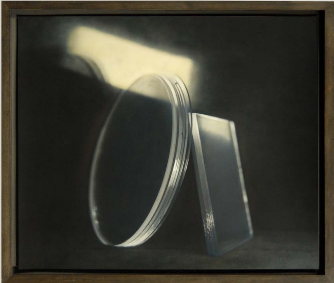
Sans titre, série "GLAS", 2015.

Tirage argentique rehaussé à la peinture à l'huile. 40 x 50 cm. Edition de 8 exemplaires